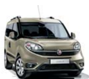
261 Beżowy Spumante (metalizowany)