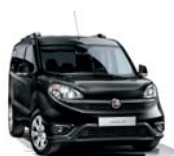
632 Czarny Tenore (metalizowany)