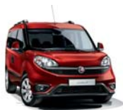
168 Czerwony Passione (pastelowy)