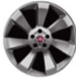
Obłęczce ze stopów lekkich 16"