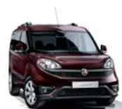
590 Bordowy Montalcino (metalizowany)