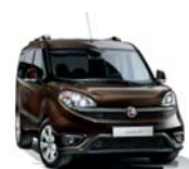
444 Brązowy Magnetico (metalizowany) tylko dla wersji Trekking