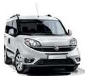
249 Biały Gelato (pastelowy)