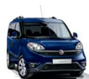
487 Granatowy Mediterraneo (metalizowany)