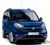
479 Granatowy Riviera (pastelowy)