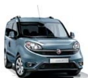
448 Niebieski Canalgrande (metalizowany)