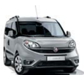
612 Szary Maestro (metalizowany)