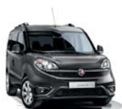
695 Szary Colosso (metalizowany)