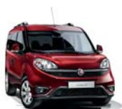
293 Czerwony Amore (metalizowany)