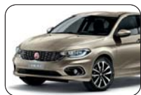
722 Perłowy Sabbia (metalizowany)