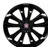
Obręcze ze stopów lekkich 17"