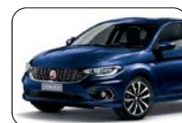
717 Niebieski Mediterraneo (metalizowany)