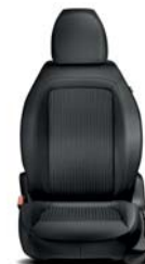
879 Materiałowo-skórzana czarna