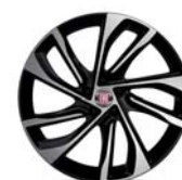
Obręcze ze stopów lekkich 18"