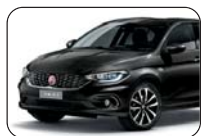
718 Czarny Cinema (metalizowany)