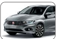
612 Szary Maestro (metalizowany)