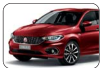
716 Czerwony Amore (metalizowany)