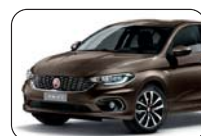
444 Brązowy Magnético (metalizowany)