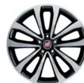
Obręcze ze stopów lekkich 17"