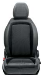
015 Tkanina czarno - szara