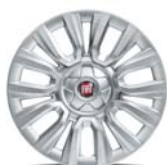
Obręcze stalowe 15" z kołpakami