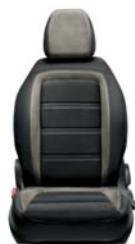
301 Tkanina ciemnoszara z jasnymi wstawkami