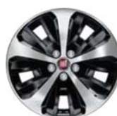
Obręcze ze stopów lekkich 16" tylko dla pakietu ECO