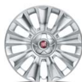
Obręcze stalowe 16" z kołpakami