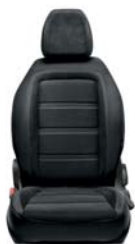
314 Tkanina czarna