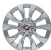
Obręcze ze stopów lekkich 16"