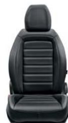
404 Skóra ekologiczna czarna