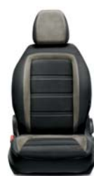
301 Tkanina ciemnoszara z jasnymi wstawkami