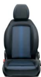
049 Tkanina szaro-niebieska