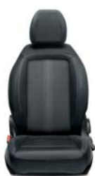
519 Tkanina szara