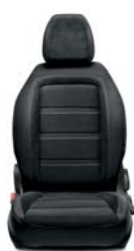
314 Tkanina czarna