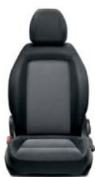
030 Tkanina szara