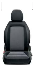
030 Tkanina szara