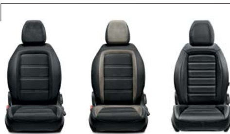
645 Tkanina czarna