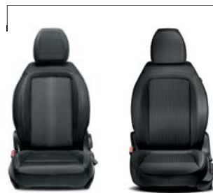
025 Tkanina czarno-szara z ciemnoszarymi szwami