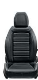
404 Skóra czarna