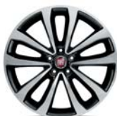
17" felgi aluminiowe dla wersji Lounge (opcja) 55E