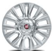
15" felgi stalowe z kołpakami dla wersji Pop 4WQ