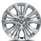
16" felgi aluminiowe dla wersji Pop (opcja) / Lounge 1M1