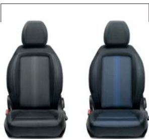
519 Tkanina szara