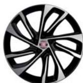
18" felgi aluminiowe dla wersji Lounge (opcja) / S-Design (opcja) 439