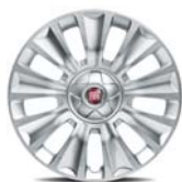
16" felgi stalowe z kołpakami dla wersji Pop (opcja) 1M0