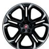
18" felgi aluminiowe dla wersji Sport (opcja) OR2