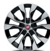
16" felgi aluminiowe dla wersji Mirror 1M4