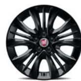
16" felgi aluminiowe dla wersji Street 1M3