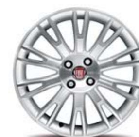
50901339 17-calowe felgi ze stopu (Linia Akcesoriów Fiata)