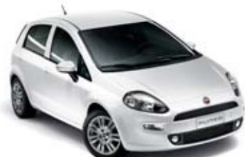
296 BIAŁY GELATO