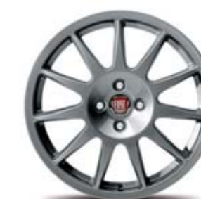
50902243 17-calowe polerowane felgi ze stopu (Linia Akcesoriów Fiata)