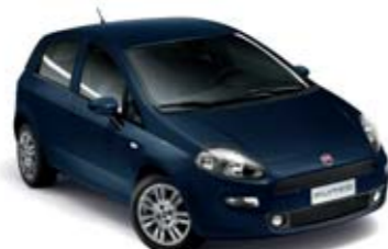
475 NIEBIESKI RIVIERA