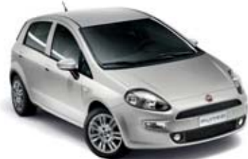
348 SZARY ARGENTO