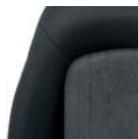
CZARNY/SZARY SZARE WSTAWKI