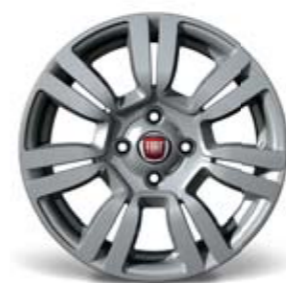
108 Felgi ze stopów lekkich 15", opony 185/65/15