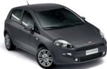
679 SZARY MODA