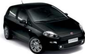
876 CZARNY TENORE