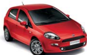
176 CZERWONY PASSIONE