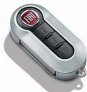
Srebrna szarość matowa