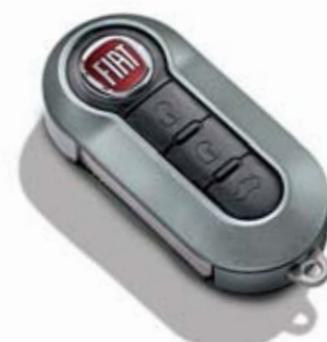
Tytanowa szarość matowa