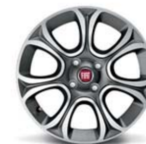
50902778 16-calowe polerowane felgi ze stopu z diamentowym wykończeniem (Linia Akcesoriów Fiata)