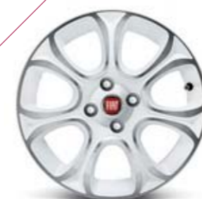
50902779 16-calowe białe felgi ze stopu z diamentowym wykończeniem (Linia Akcesoriów Fiata)