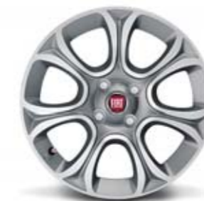
439 Felgi ze stopów lekkich 16", opony 195/55/16 (bez możliwości montażu łańcuchów)