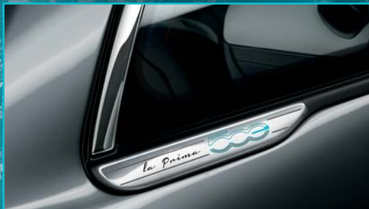
Ekskluzywny emblemat „la Prima”