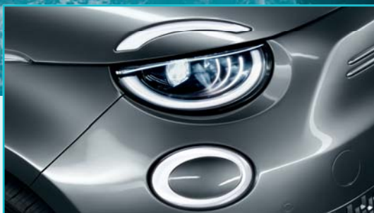
Światła LED Infinity