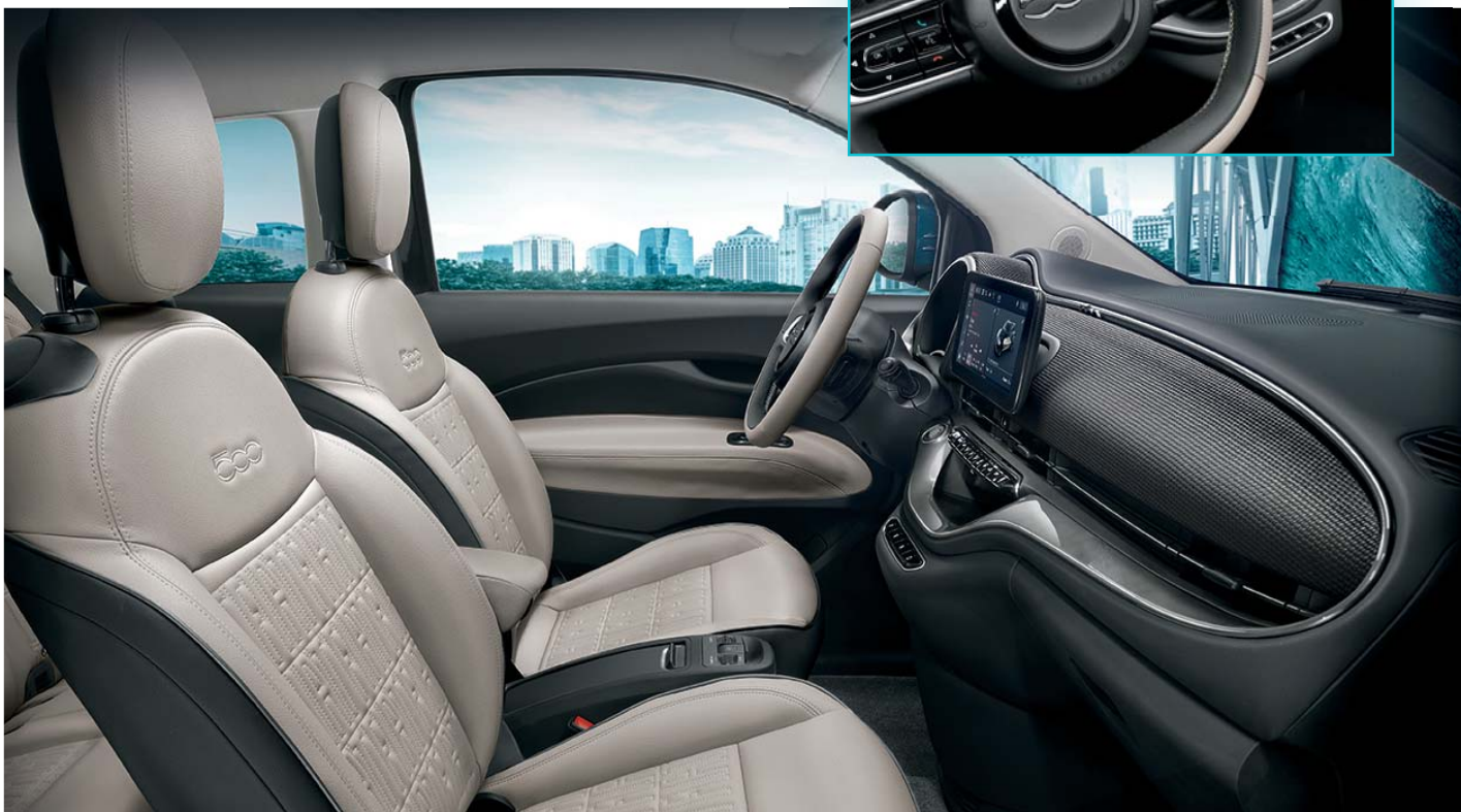
Fotele z monogramem Fiat