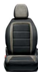
301 Tkanina ciemnoszara z jasnymi wstawkami