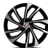
Obłęczce ze stopów lekkich 18" 439